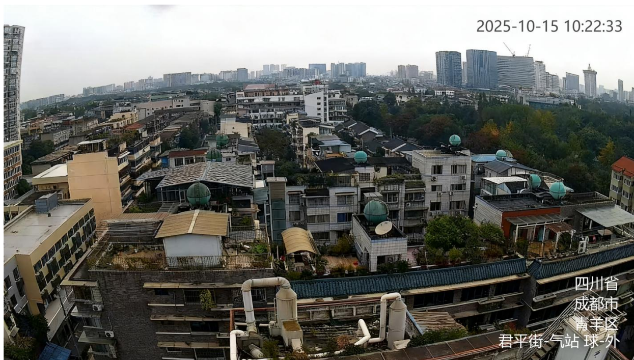
图 A.1 大气监测站监控视频信息标注示例

A.1 大气监测站监控视频的地点信息、用途信息为：站点名称-气站，如：君平街-气站。标注示例见图 A.1。