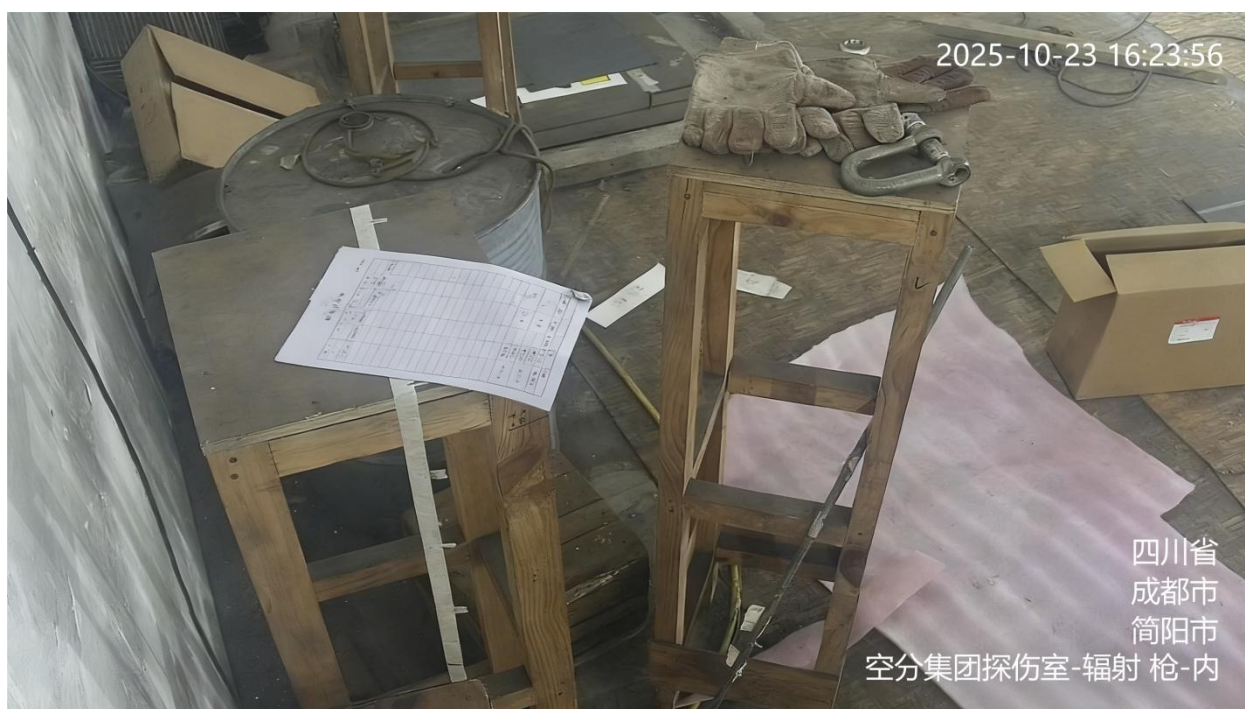
图 A.6 涉核企业监控视频信息标注示例

A.7 工业园区监控视频的地点信息、用途信息为：园区简称-园区，如：沿滩工业区-园区。标注示例见图 A.7。