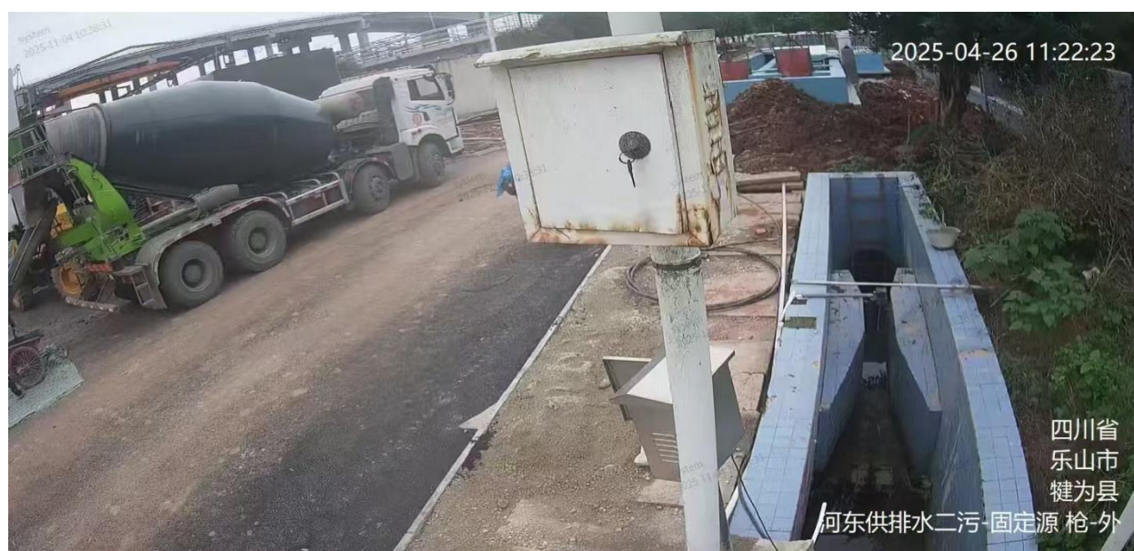
图 A.4 固定污染源企业监控视频信息标注示例

A.4 固定污染源企业监控视频的地点信息、用途信息为：企业简称监控区域-固定源，如：河东供排水二污-固定源。标注示例见图 A.4。