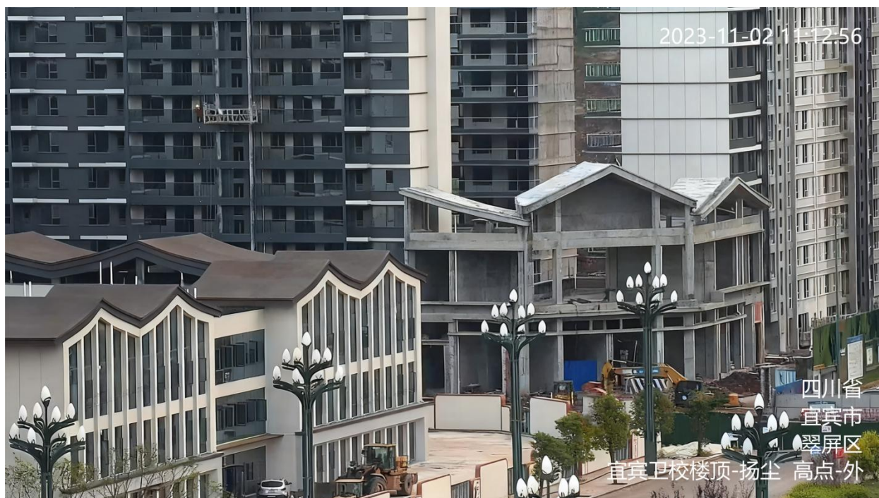
图 A.9 扬尘监控视频信息标注示例

A.9 扬尘监控视频的地点信息、用途信息为：安装位置-扬尘，如：宜宾卫校楼顶-扬尘。标注示例见图 A.9。