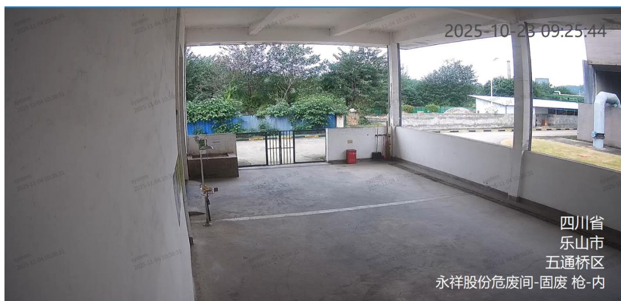
图 A.5 固体废物企业监控视频信息标注示例

A.5 固体废物企业监控视频的地点信息、用途信息为：企业简称监控区域-固废，如：永祥股份危废间-固废。标注示例见图 A.5。