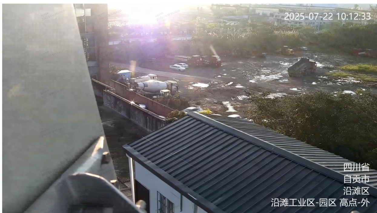
图 A.7 工业园区监控视频信息标注示例

A.7 工业园区监控视频的地点信息、用途信息为：园区简称-园区，如：沿滩工业区-园区。标注示例见图 A.7。