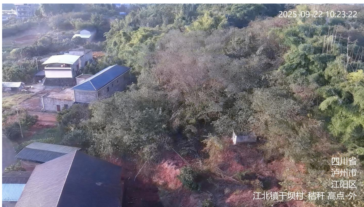
图 A.8 秸秆焚烧监控视频信息标注示例

A.9 扬尘监控视频的地点信息、用途信息为：安装位置-扬尘，如：宜宾卫校楼顶-扬尘。标注示例见图 A.9。