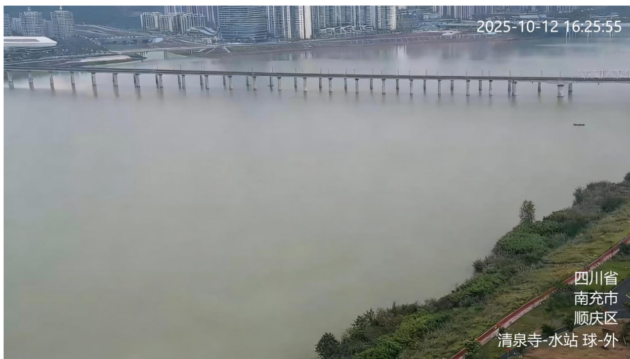
图 A.2 水质监测站监控视频信息标注示例

A.2 水质监测站监控视频的地点信息、用途信息为：站点名称-水站，如：清泉寺-水站。标注示例见图 A.2。