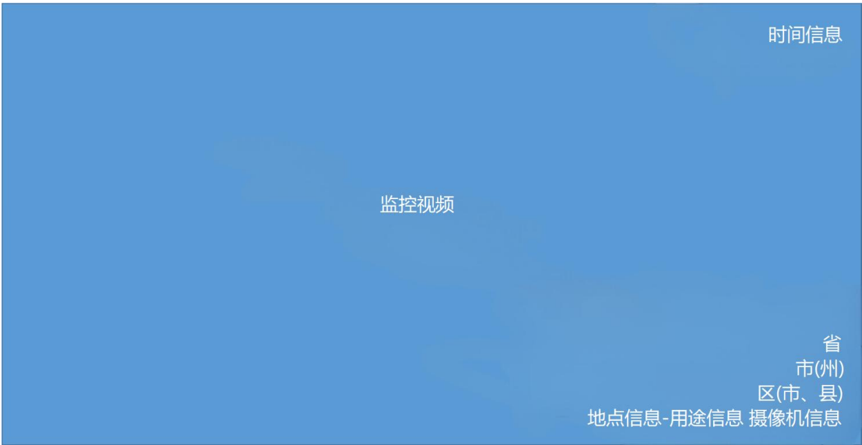
图 2 信息标注位置示意图

时间信息应标注在右上角，字符上沿与监控画面上边缘保持1个汉字距离，字符串尾与右边缘保持1个汉字距离。