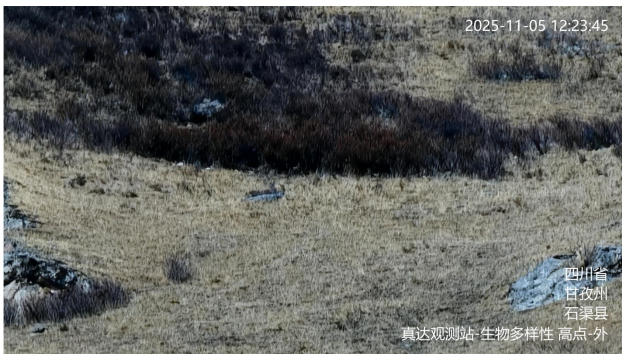
图 A. 10 生物多样性监控视频信息标注示例

A. 11 机动车遥感监控视频的地点信息、用途信息为：道路简称-机动车遥感，如：裕度大道-机动车遥感。标注示例见 A. 11。