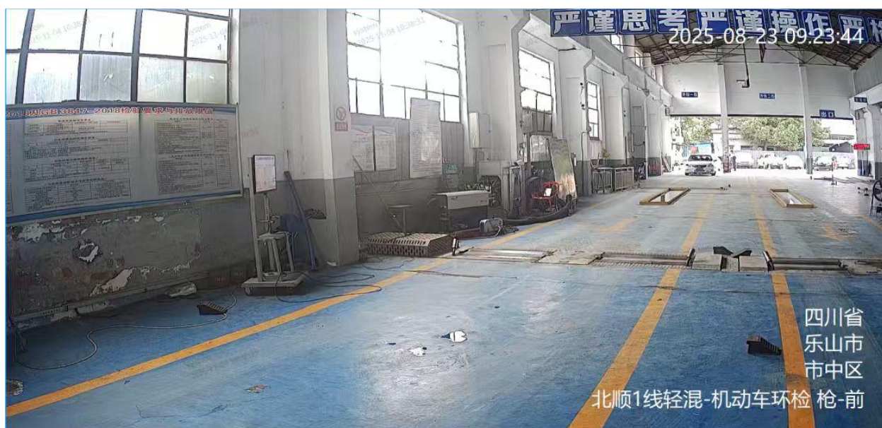
图 A. 12 机动车环检监控视频信息标注示例

A. 13 机动车门禁监控视频的地点信息、用途信息为：企业简称监控区域-机动车门禁，如：国耀铝业-机动车门禁。标注示例见图 A. 13。