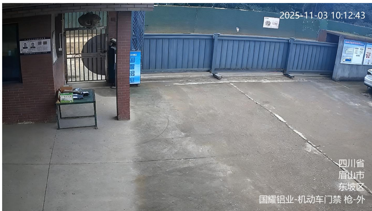
图 A. 13 机动车门禁监控视频信息标注示例

A. 13 机动车门禁监控视频的地点信息、用途信息为：企业简称监控区域-机动车门禁，如：国耀铝业-机动车门禁。标注示例见图 A. 13。