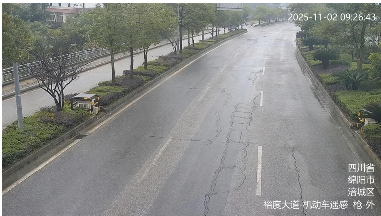
图 A. 11 机动车遥感监控视频信息标注示例

A. 11 机动车遥感监控视频的地点信息、用途信息为：道路简称-机动车遥感，如：裕度大道-机动车遥感。标注示例见 A. 11。