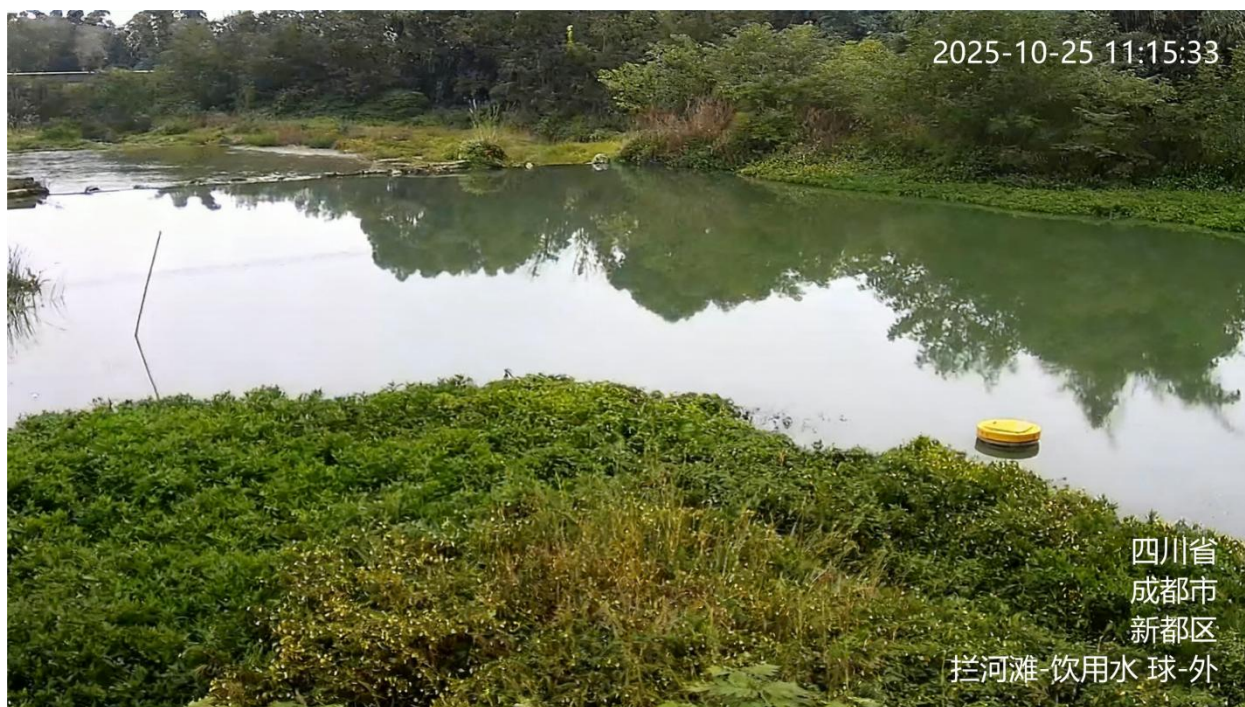
图 A.3 饮用水源地监控视频信息标注示例

A.3 饮用水源地监控视频的地点信息、用途信息为：水源地名称-饮用水，如：拦河滩-饮用水。标注示例见图 A.3。